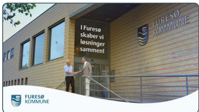
TV-spot på TV2 Lorry - første gang vist den 13. januar 2015

Vi har bevidst kommunikeret resultaterne til omverdenen. Vi har arbejdet med et bredt fokus gennem kampagner rettet mod borgere, der hver dag pendler ud af kommunen, og f.eks. TV-spots, der skal tiltrække flere virksomheder.